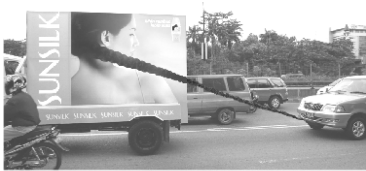
Gambar 1. Contoh Iklan Ambient Media Sun Silk “Tow Truck”